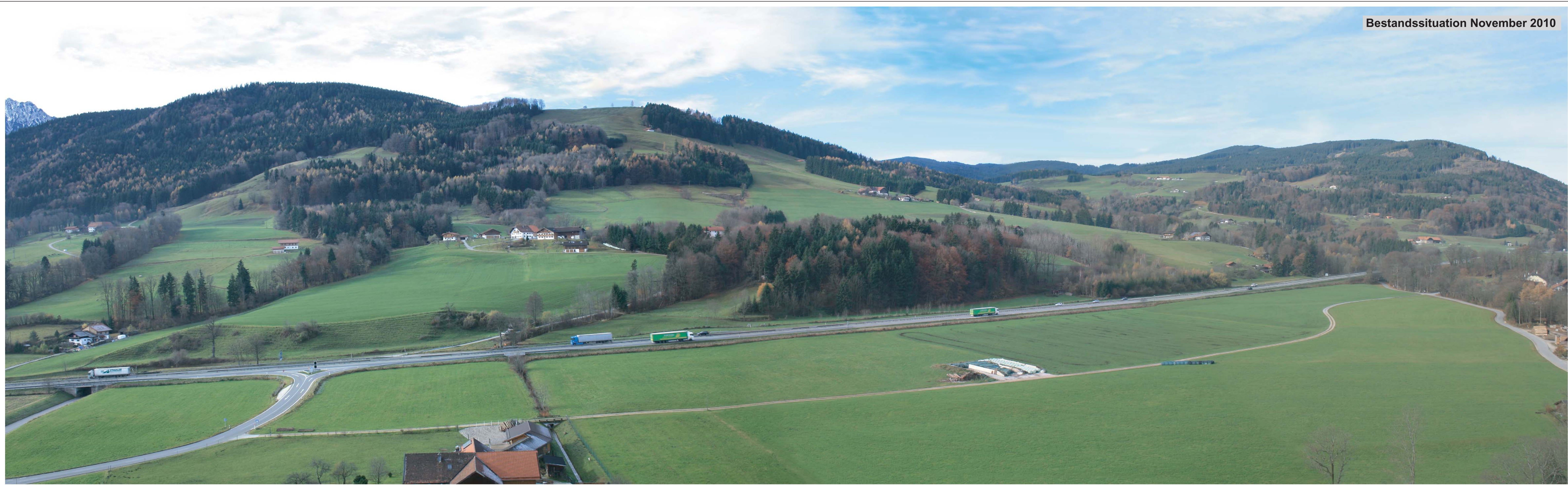
Bestandssituation November 2010