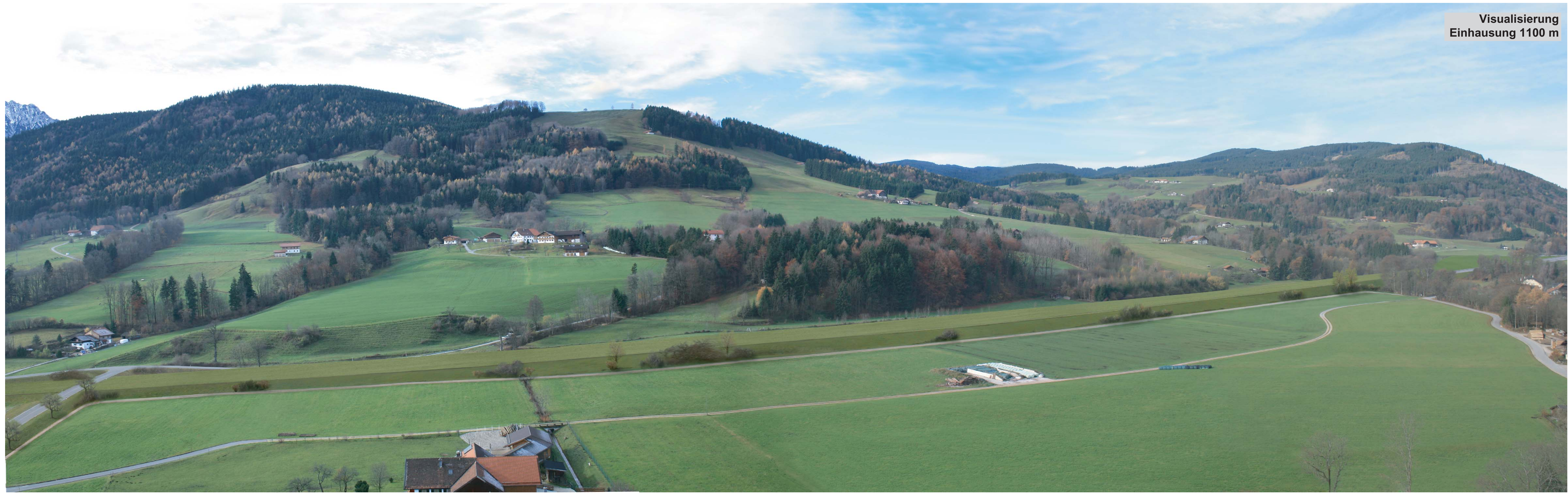
Visualisierung Einhausung 1100 m